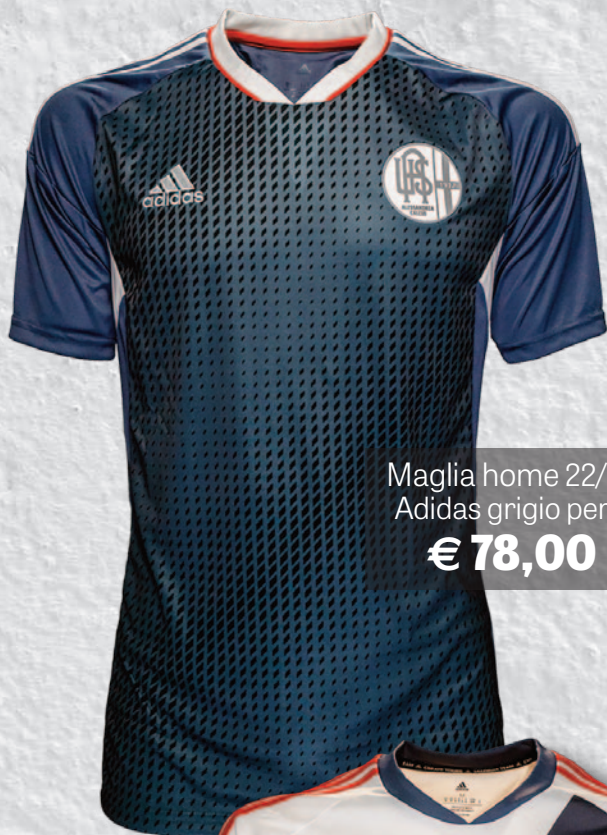
Maglia home 22/23 Adidas grigio pers. € 78,00

Per i vostri acquisti on line: orshop.alessandriacalcio.it