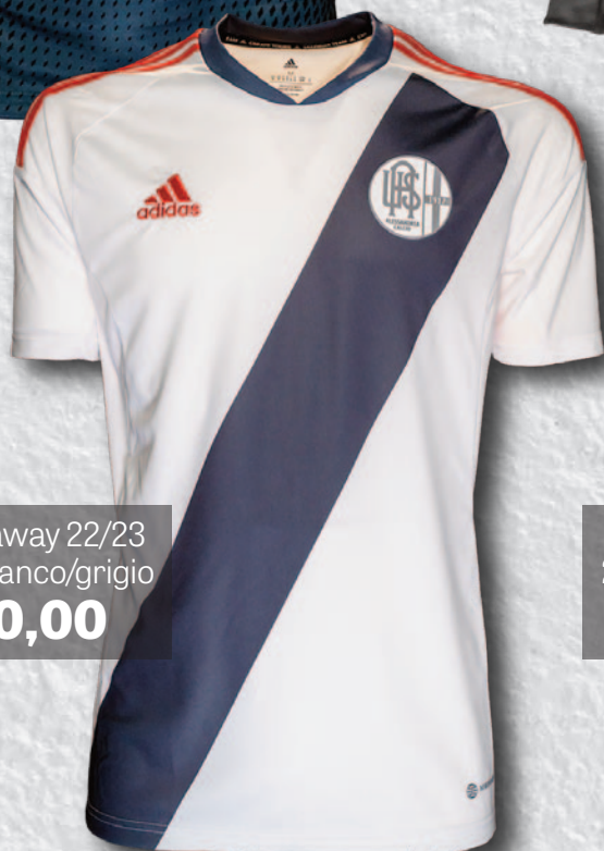
Maglia away 22/23 Adidas bianco/grigio € 70,00