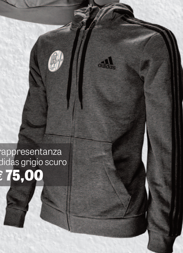
Felpa rappresentanza 22/23 Adidas grigio scuro € 75,00