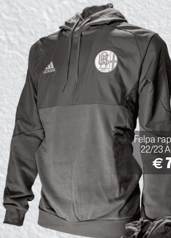
Felpa rappresentanza 22/23 Adidas grigio € 75,00