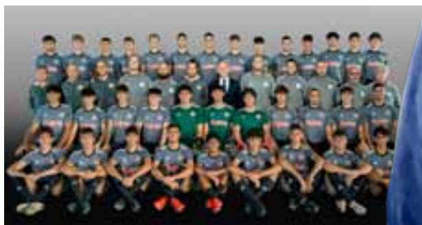
La Primavera 2

«Tutta l'area portieri è molto coesa, crediamo molto nella crescita dei ragazzi e abbiamo un continuo confronto con Andrea Servili al fine di fornire alcune linee guida ai calciatori nel momento in cui salgono in prima squadra, cosicché possano riconoscere il lavoro che si svolge. Noi lavoriamo cercando di costruire ogni singolo gesto: partiamo da una base analitica nella fase di riscaldamento per poi passare a lavori misti globali fino a portare i ragazzi al lavoro con la squadra. La linea guida è la stessa per tutto il settore giovanile, così se i ragazzi cambiano categoria riconoscono comunque sempre